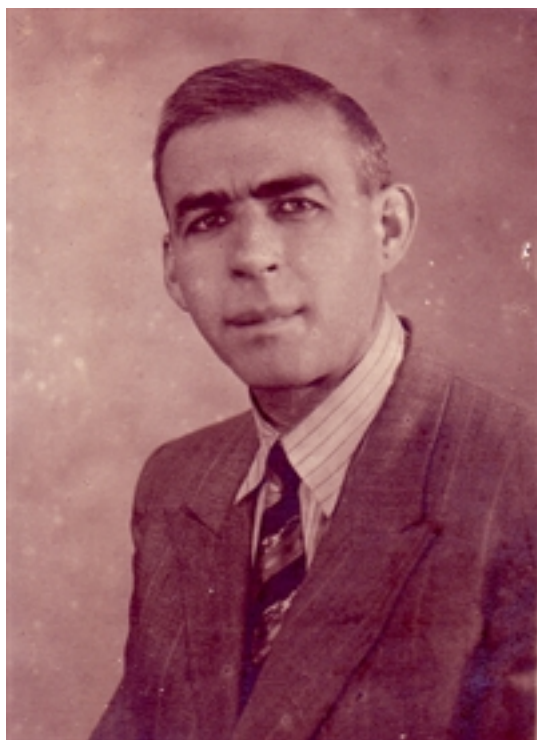
Lajos Iván az 1930-as évek közepén