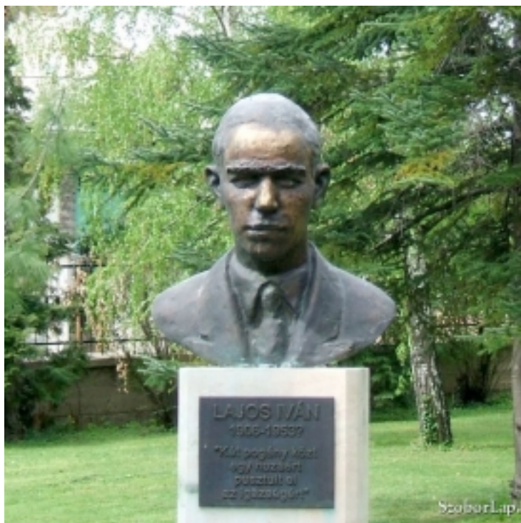
Lajos Iván mellszobra a Pécsi Akadémiai Bizottság székházának kertjében, Firnigel Tibor alkotása (a kép forrása: Köztérkép [8])

A kérvényezés folyamatának további ismertetését követően, a rektor ünnepélyesen felkérte a prorektort és a jogi kari dékánt, hogy értesítsék a kormányzó képviselőjét, aki csak ezt követően érkezett meg a terembe. A rektori üdvözlésre Petri így válaszolt: „Őszinte örömmel jöttem ide (...) nemcsak a magas kiküldőm iránti hódolattól vezettetve, hanem azért is, mert a pécsi egyetemhez oly sok barátság fűz, hogy mindig együtt örülök a pécsiek örömeivel. Az egyetemi professzorok működésének tárgya egyfelől a tudományokban való elmélyedés, másfelől pedig a fiatal tehetségek felkeresése és kutatása. A mai ünnep azt bizonyítja, hogy a pécsi egyetem tanári mindkét hivatásukat átérzik.”